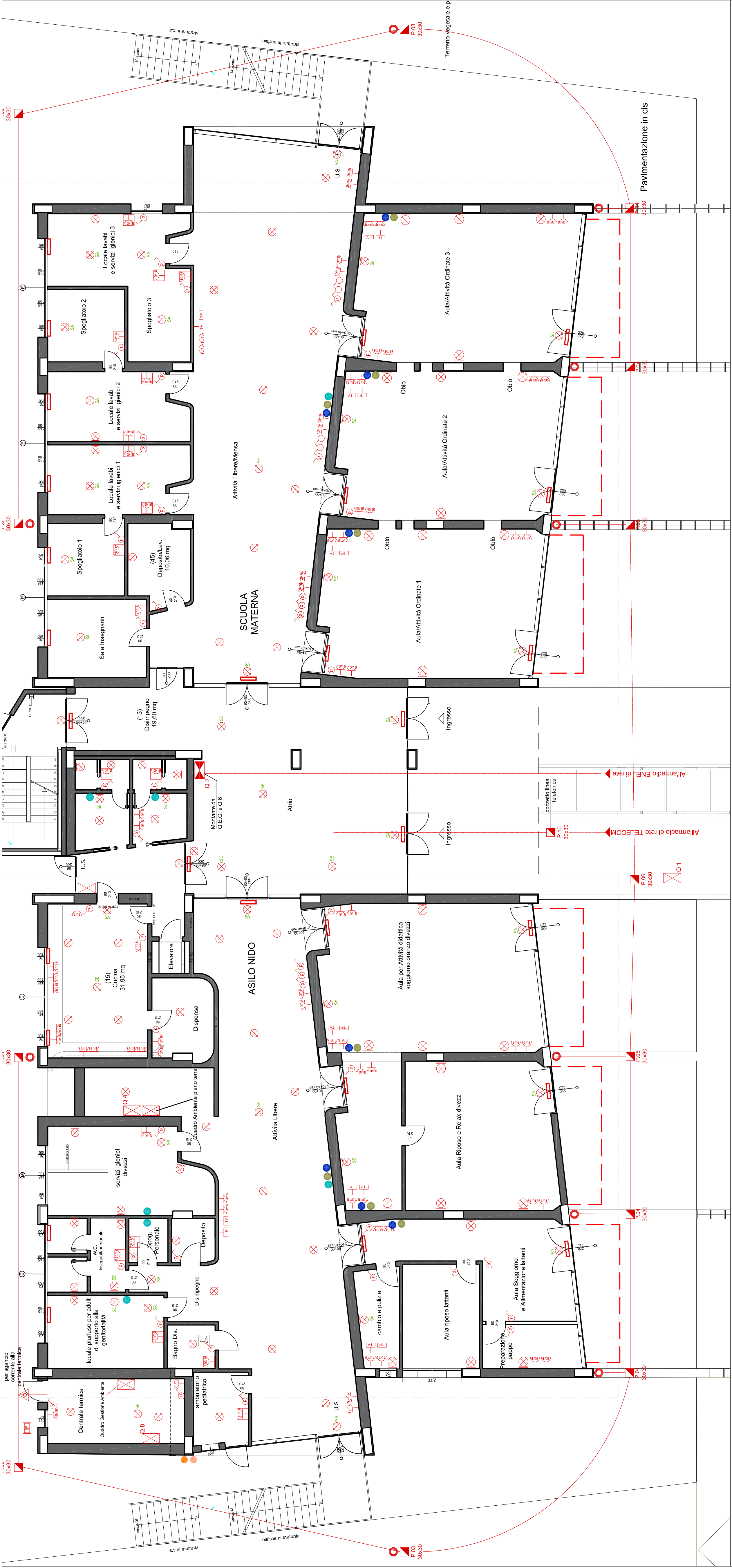
PIANTA PIANO TERRA scala 1/100