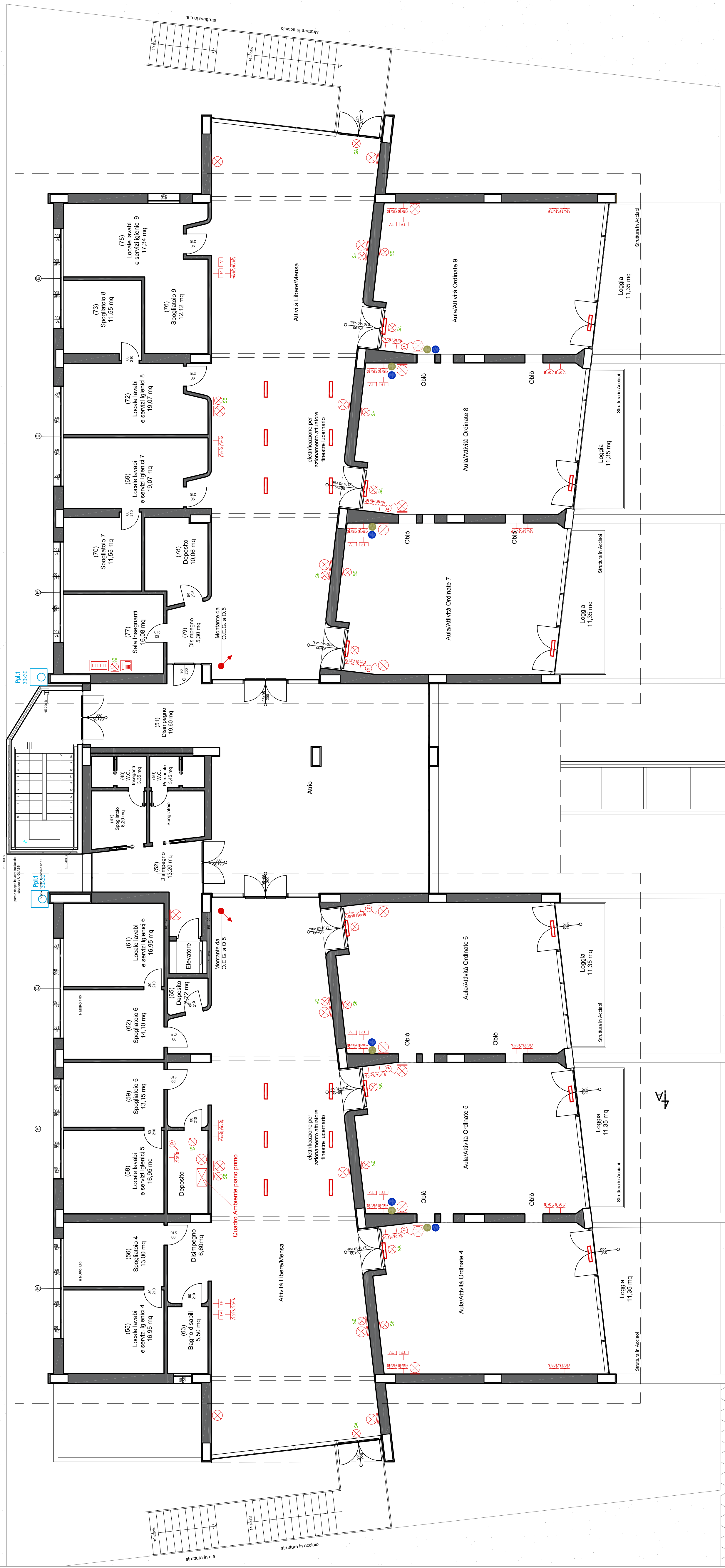
PIANTA PIANO PRIMO scala 1/100